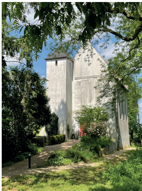
Abb. 4: Evangelische Kirche Mörmter, Düsterfeld 24, 46509 Xanten (Kirchhof linke Seite)

frau und die Reisegruppe geistlich zugehörig fühlten. Er hat ihren Toten auf dem Kirchhof seiner Gemeinde begraben lassen. 32